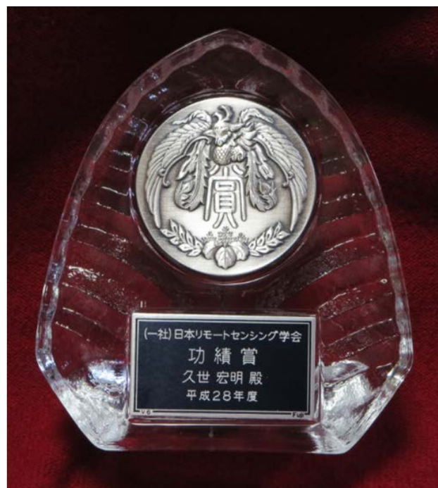
賞状と記念のクリスタルの盾です。永年の活躍は計り知れないものです。