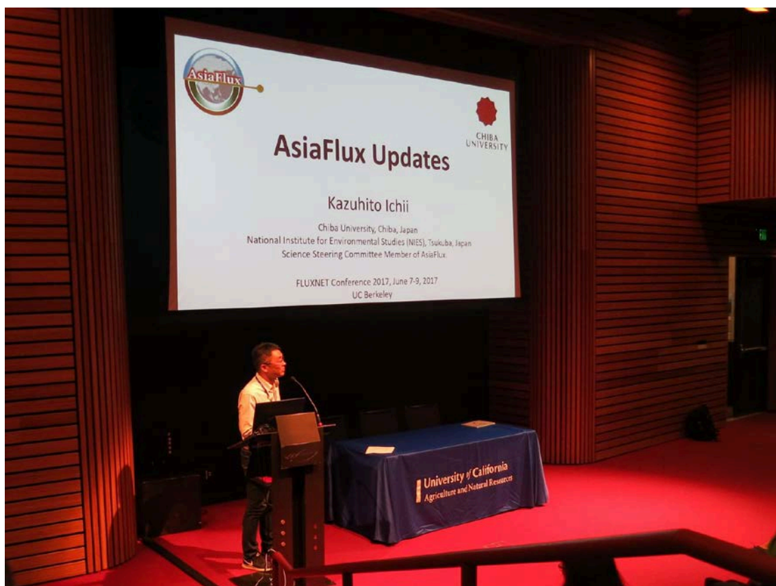
写真 1. 筆者の発表風景