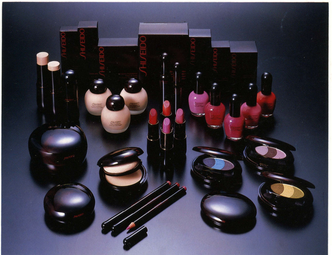
資生堂海外向け用メーキャップ化粧品 AD:杉浦俊作 D:伊藤透