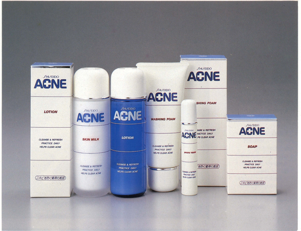
資生堂アクネ(ニキビ肌用薬用化粧品シリーズ) AD:熊井保亥 D:金子陽一