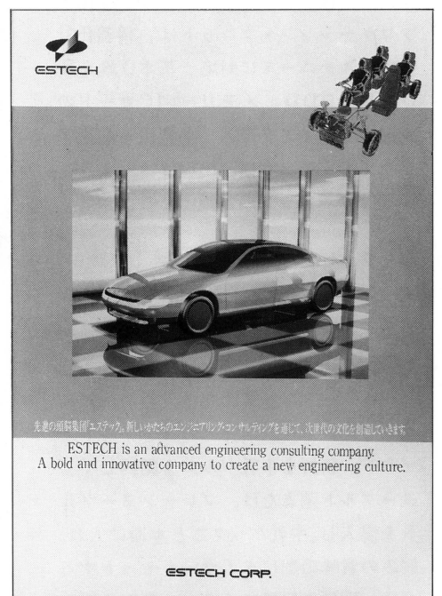
●(株)エステック会社案内(和・英併記) デザインコーディネートおよびコピー作成