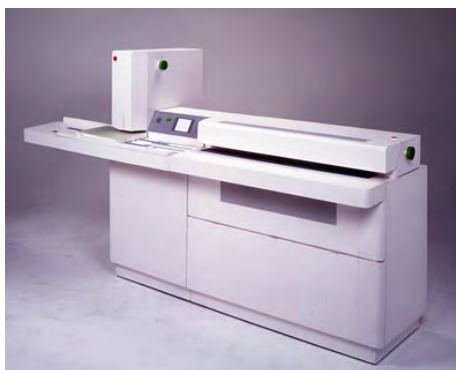
高齢者対応自動製本システム