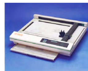
カッティングシステム