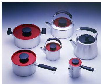
キューピー調理器 (Gマーク受賞)