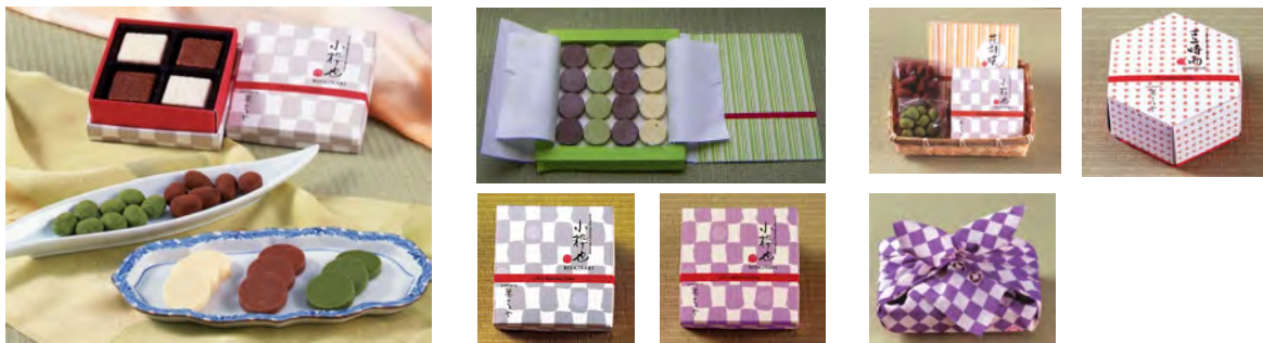
(株)イトーヨーカドーPB和菓子銘店[菓の子や] 2006年 和風バレンタイン企画

名称 菓の伝 ネーミング・小粋也・花胡蝶・豆時雨、レシピ、パッケージデザインディレクト、ディスプレイ