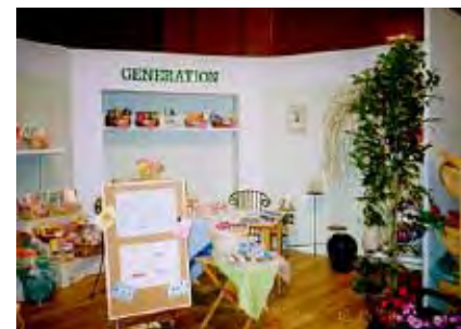
(株)サンエス1997年コンフェクショナリー・フェア 5ブースディスプレイ 企画制作