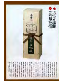
力士の吟醸酒 ネーミング 不知不識しらずしらず 1989 製造: 釜屋 パッケージ 舘武 企画 絆リサーチ