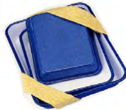
ホーローのスパター模様パッド 1988 製造: 野田ホーロー

商品開発・マーチャンダイジング・企画制作: 絆リサーチ・コーヨー社家庭用品の研究、コンセプトメイキング、ネーミング、売場ゾーニング、商品・パッケージデザイン、什器、パンフレット まで一連のマーケティングデザインの開発