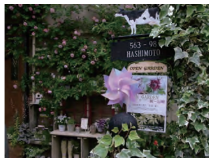
8. 流山オープンガーデンのための住民主導のサイン・キットの提案：大学院生との共同提案（2010～） “Location Sign Kit for Nagareyama Open Garden Festival” 2010