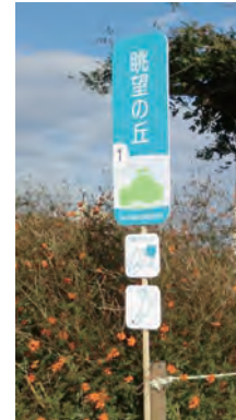
7. 流山の魅力再発見 春・秋の散策会のためのロケーション・サイン、誘導サイン、案内サイン等の継続的デザイン提案：大学院1年生との共同制作（2010～） .“Location Sign System for Nagareyama Walking” 2011