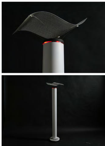
5. Soundscape in Lonmiladonno: Lonmiladonno火山 灰展のための音環境インスタ レーション作品 (2011. 11) “Soundscape in Lonmiladonno” Sound Installation for Exhibition 2011