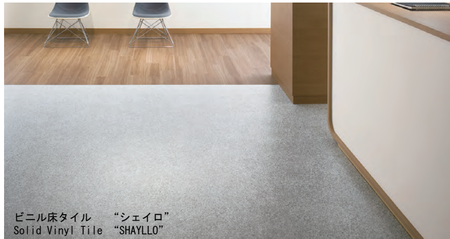
ビニル床タイル “シェイロ” Solid Vinyl Tile “SHAYLLO”

94. 4. 東り (株) 商品本部デザイン室 (現フロア企画部デザインG)、 08. 4. 床材チーフデザイナー 趣味：写真、MTB モットー：取り敢えずやってみる。