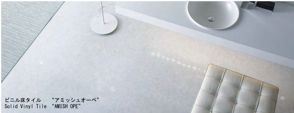
ビニル床タイル “アミッシュオーベ” Solid Vinyl Tile “AMISH OPE”

ビニル床タイル / チップインレイドタイルシリーズ / 2002 ( Solid Vinyl Tile / Chip Inlaid Tile Series / 2002 )