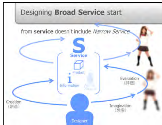
サービスデザインのフレーム提案2008