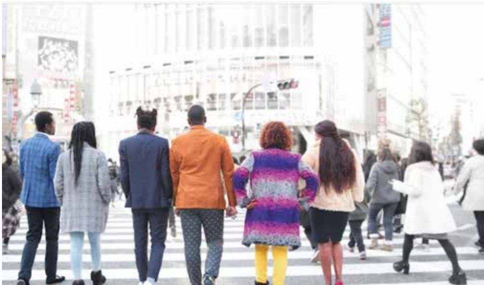
図1 「カラフル」な難民たち