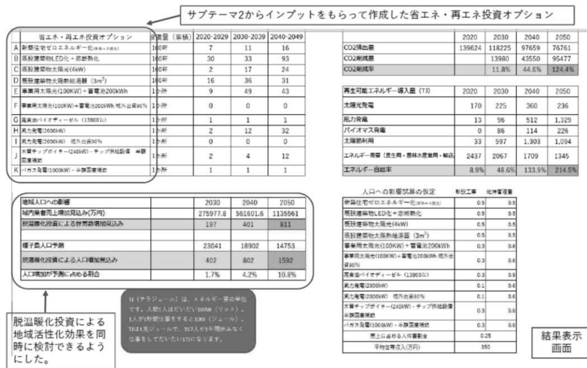
【図3】 脱炭素シミュレータ結果表示画面

たいが、サブテーマ1に関する部分としては、とくに「脱炭素シミュレーションゲームの実施」があげられる。この実施にあたり、20台のタブレットPC/Ipadを用意して、それを参加者間で回して数値を入力してもらった形とした。ゲームの結果、7割の班が、2050年に脱炭素を実現できたが、ゲームの意味を理解させるだけの十分な説明ができず、午後の政策提言において、脱炭素に関する政策提言はほとんどみられないという結果となった。シミュレーションの内容、伝え方などを改善することが必要であるが、各市町村において、2050年に脱炭素を実現している状況を構築して、そこからバックキャストで考える形に改良することを考えている。