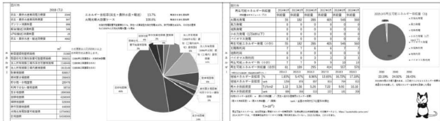
【図2】 未来カルテ 2050 より