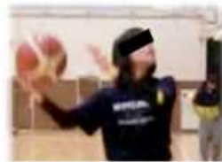
図1 大きなフックシュート型

未熟練者への指導を考えた際、下位群のより詳細な分析が必要であると考え、印象分析により下位群を、弧を描くように腕を体の横から大きく振り回す「大きなフックシュート型」と、ワンハンドセットシュートに似た「セットシュート型」の2つに分類した(図1,2)。