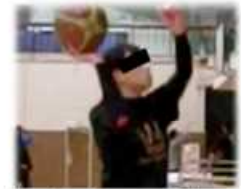
図2 セットシュート型

リリース直前 0.17 秒間における肘関節角度変化を比較すると、大きなフックシュート型群と上位群、大きなフックシュート型群とセットシュート型群の間に 5 %水準で有意な差が認められた(図3)。大きなフックシュート型群の肘関節角度変化が小さいことから、大きなフックシュート型は、ボールの挙上に肘関節の伸展動作をあまり利用できていないという特徴がみられた。